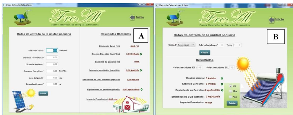
Figura 2. Ventanas de cálculo: a) paneles fotovoltaicos y b) calentadores solares