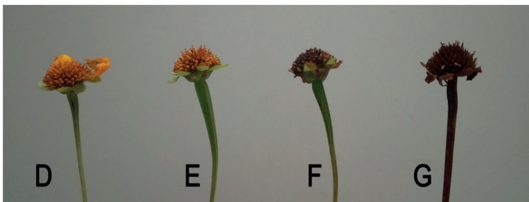
Photo 2. Inflorescences that produce seeds. D- Seed heads with green bracts and withered petals, E- Seed heads with green bracts and yellow corollas, F- Seed heads with green bracts and brown corollas, G- Seed heads with dry bracts and peduncles (brown)