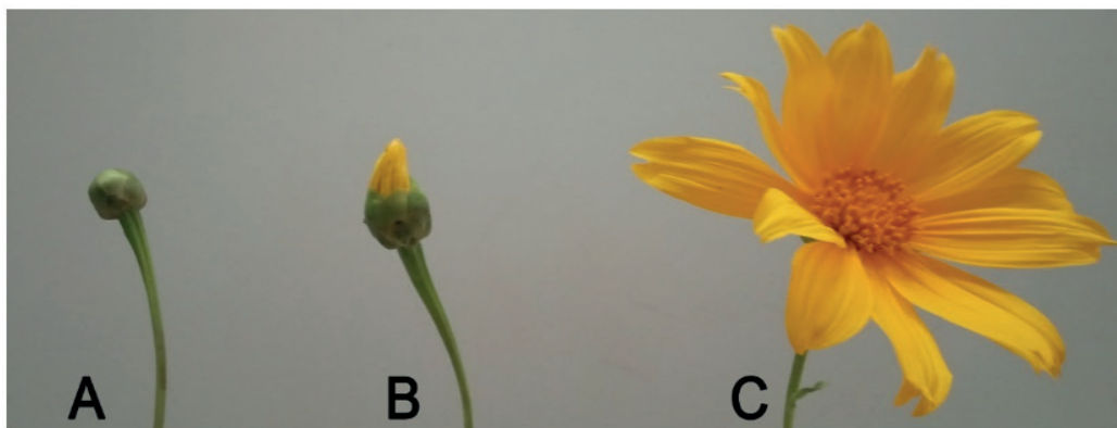
Photo 1. Inflorescences that do not produce seeds. A- Closed bud, B- Open bud, C- Flower

En la foto 1 y 2 aparecen los cambios fenológicos que se presentan en la cabezuela en el proceso de maduración y formación de los achenios y se definen los estados fenológicos que producen semillas de acuerdo a la morfología de la cabezuela, así como los cambios de color que se producen a partir del inicio de la floración masiva. Este momento ocurre cuando del total de tallos con presencia de inflorescencias presentes en el campo,